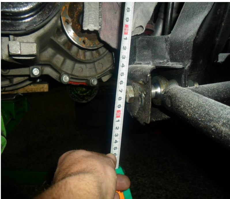
Distancia desde orificio larguero (según grafica foto siguiente) al centro de eje de parrilla anterior 275mm.